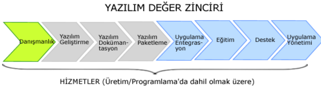
Şekil 2: Yazılım Değer Zinciri-II

Değer zinciri genel olarak, 3 ana kısımdan oluşmaktadır. Bunlar; 1) Üretim/Programlama 2) Pazarlama/Satış ve 3) Hizmetler'dir. Yukarıda verilen değer zincirindeki bileşenler sabit kalarak farklı yönlerden farklı dizilimlerde görülebilir. Örneğin yukarıdaki zincir daha çok arz'dan talep tarafına doğru genel bir zincirdir. Aşağıdaki şekil ise daha çok müşterinin bir uygulama yazılımı için takip edilecek zinciri göstermektedir.