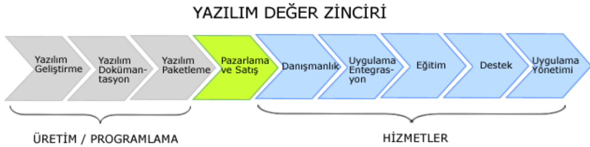
Şekil 1: Yazılım Değer Zinciri-I

veya bu platform üzerinde çalışacak uygulama yazılımını kapsayabilmektedir. Her ikisi veya sadece ikincisi için özel lisans anlaşması çerçevesinde sağlayıcı firma ücret talep edebilir. Diğer yandan, yazılıma yönelik hizmetler kısmı danışmanlık, kurulum-uygulama, destek, eğitim ve uygulama yönetimini kapsamaktadır. Sağlayıcı bunların bir veya birkaçından gelir elde edebilmektedir. Kurumsal çözümler her zaman özelleştirme ihtiyaçlarını içerir. McKinsey'in yaptığı bir araştırmaya göre ERP sistemleri için kurulum ve lisans bedeli toplam tutarın yüzde 30'u iken yazılımın uyarlanması gibi profesyonel hizmetler tutarın yüzde 70'ine karşılık gelmektedir. Bahsedilen değer zinciri aşağıdaki şekilden daha net bir şekilde anlaşılabilir.